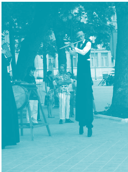
Театър Квелб (Чехия) Theatre Kvelb (Czech Republik)

British Council – Bulgaria ITF Varna Summer Working meeting: Writing for the Space – Visualizing the Play Led by Gabriel Gbadamosi (UK) → ITF Varna Summer 2005