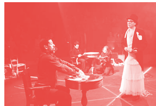
rehearsal. Hamiel, Cia Dos Aiores (Brazil) "ренетация. Хамлет", Комп. Дос Аiores (Бразилия)

Българска асоциация за театър Български център на ОИСТАТ Конференция: Фестивалът и градът Театърът и градът – едно ново отношение С подкрепата на Програма "ФАР" и Програма "Калейдоскоп" към ЕС → МТФ "Варненско лято" 1999