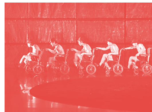
Electra , SCOT (Japan)

Българска асоциация за театър Кръгла маса: Театралната мрежа в България – перспективи за развитие → МТФ "Варненско лято" 2010