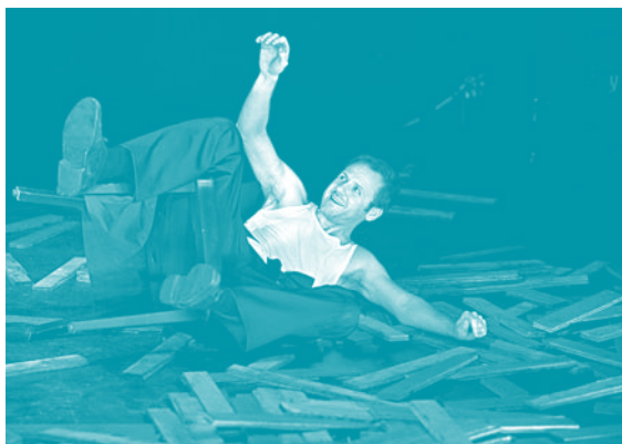
"Дневникът на един луд", Дойчес театер (Германия) Diary of a Madman, Deutsches Theater (Germany)