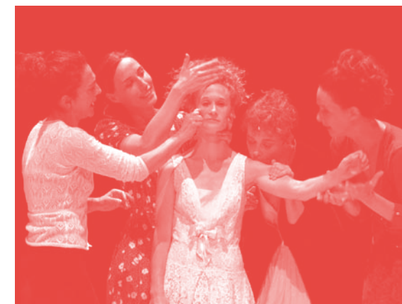
Margarita's Song, Senza Tempo (Spain) "Песента на Маргарита", Сенза Темпо (Испания)